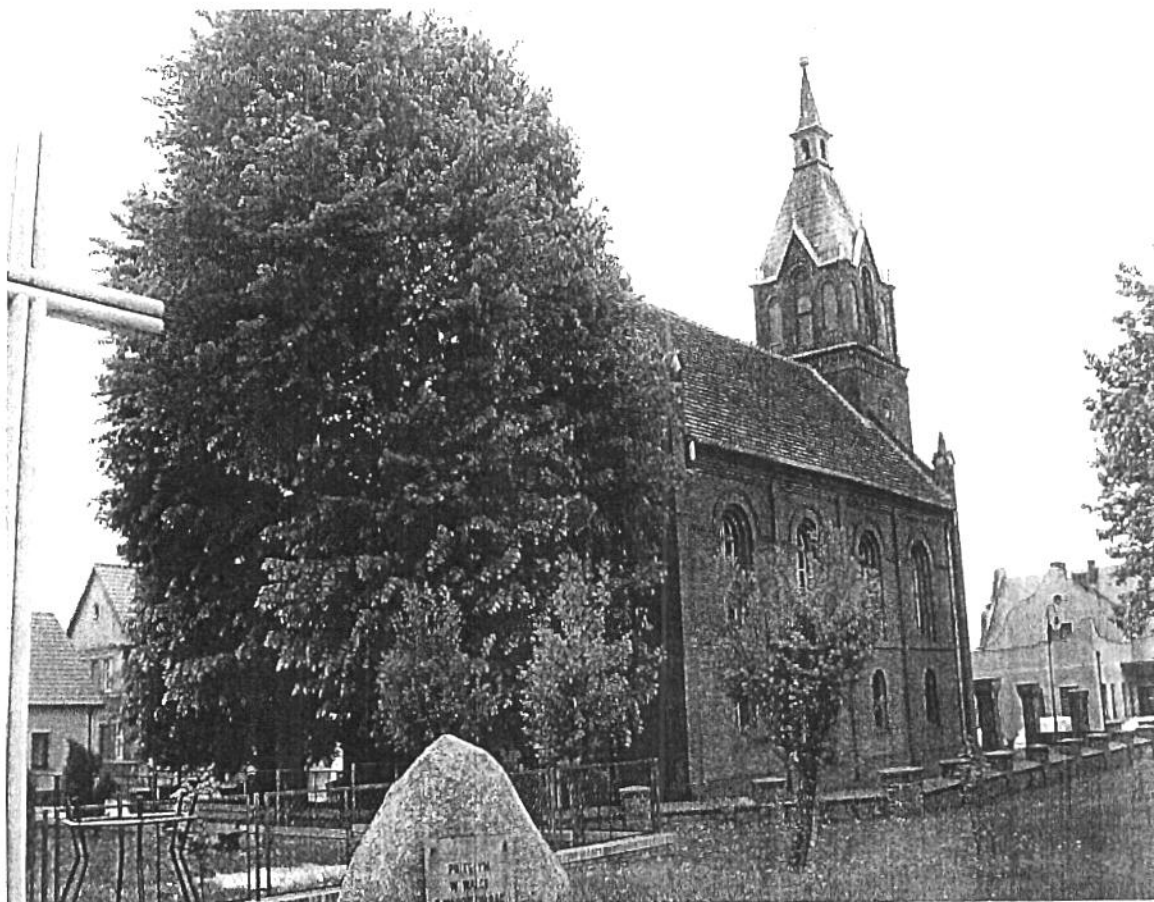
Rysunek 5 Kościół poewangelicki