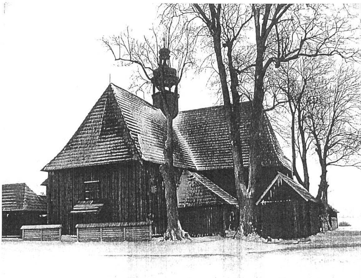
Rysunek 2 Kościół na „Na półku” w Bralinie

Obiekt wpisany do rejestru zabytków decyzją Wojewódzkiego Konserwatora Zabytków (L.dz. KI-III-53409(109)90) z 31 grudnia 1990 r., pod numerem 606/A [księga rejestrowa dawnego województwa kaliskiego].