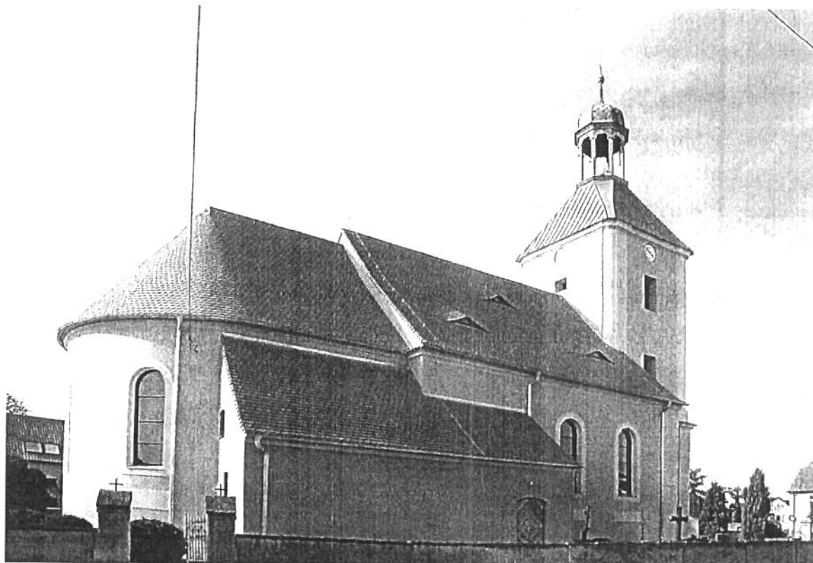
Rysunek 3 Kościół w Mníchowicach

Aleksandryjską – patronkę kościoła. W skład wyposażenia świątyni – posiadającego w zasadzie jednolity, klasycystyczny charakter – wchodzi także ołtarze boczne, przyścienna ambona, chrzcielnica oraz Stacje Drogi Krzyżowej.