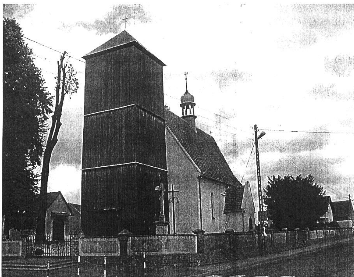
Rysunek 4 Kościół w Nowej Wsi Książęcej

Napiecka, a w tylnej części nawy ulokowana jest drewniana empora muzyczna z prospektem organowym, wsparta na dwóch słupach i zaopatrzona w dekorowaną balustradę. Wyposażenie wnętrza pochodzi z początku XIX wieku. W barokowo-klasycystycznym ołtarzu głównym, między rzeźbami świętych i kolumnami dźwigającymi belkowanie, umieszczony jest obraz przedstawiający Trójcę Świętą w otoczeniu aniołów. W prezbiterium znajdują się także rzeźby ukazujące Najświętsze Serce Pana Jezusa i Niepokalane Serce Najświętszej Maryi Panny, a w skład wyposażenia kościoła wchodzi również ołtarz boczny (z obrazem Matki Bożej) i Stacje Drogi Krzyżowej. Na miejscowym cmentarzu spoczywa ks. Michał Przywara, założyciel i członek reaktywowanego Towarzystwa Studentów Górnoślązaków na Uniwersytecie Wrocławskim w 1892 roku, znakomity historyk, językoznawca, etnograf, autor książek: "Przywiarki, czyli przesady i zabobony ludu polskiego na Górnym Śląsku"; "Narzeczka śląskie" i 50 bajek. W 1897 roku został administratorem, a następnie proboszczem parafii w Nowej Wsi Książęcej. Od 2006 r. Ks. Michał Przywara jest jednym z patronów miejscowej szkoły. Obok kościoła możemy zauważyć pomnik poległych w I wojnie światowej. Niedaleko Kościoła znajduje się plebania z 1872 roku.