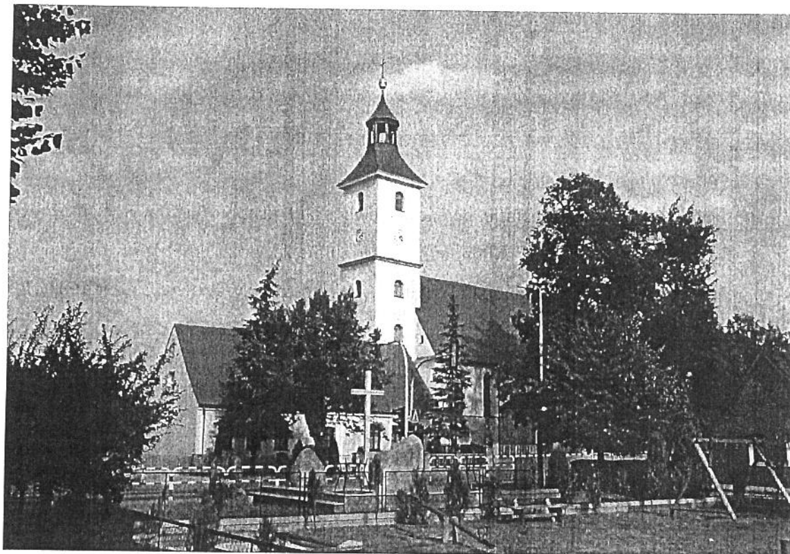
Rysunek 1 Kościół św. Anny w Bralinie

wyposażenia wnętrza wchodzi także dwa barokowe ołtarze boczne (dedykowane Trójcy Świętej i św. Antoniemu Padewskiemu), przyścienna ambona i chrzcielnica (z końca XVIII w.), gotycko-renesansowy tryptyk (przeniesiony w 1976 r. z kościoła „Na Pólku”, zrekonstruowany w 2006 r. po kradzieży części płaskorzeźb, z których dwie odzyskano w 2016 r., obecnie znajduje się w Kurii Biskupiej w Kaliszu), Stacje Drogi Krzyżowej oraz inne obrazy i rzeźby.